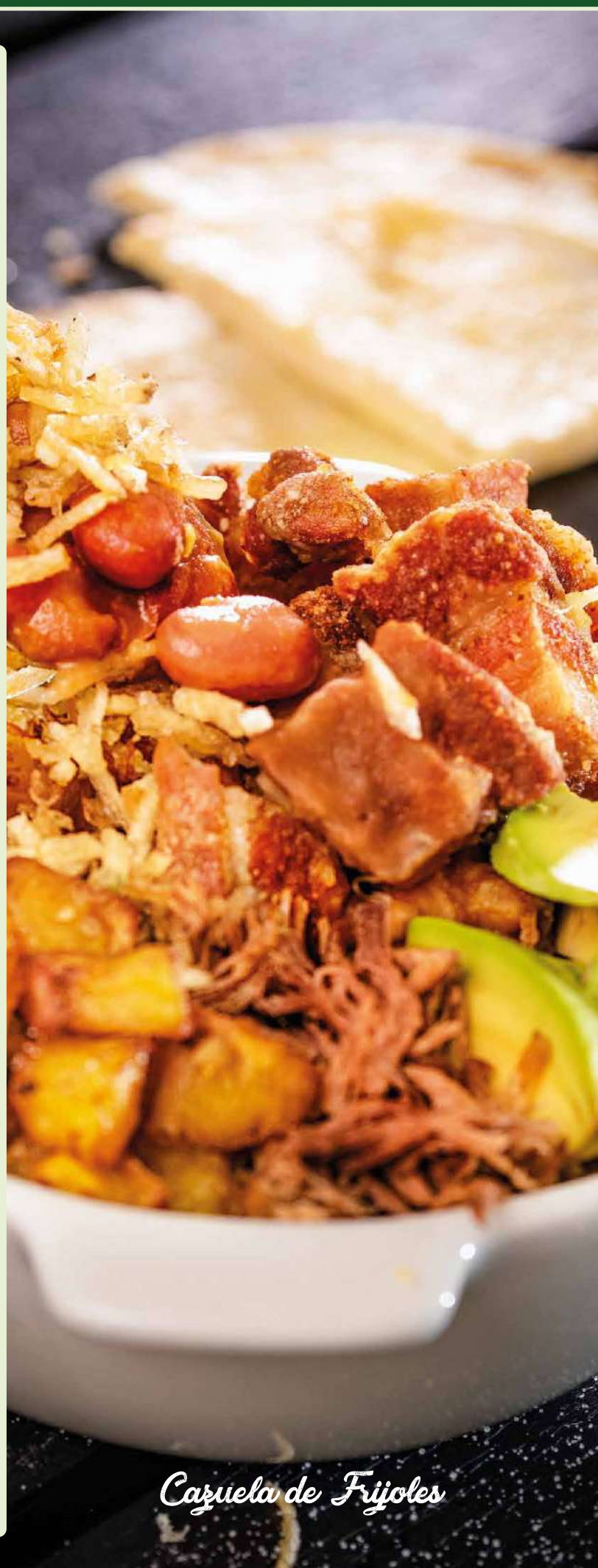
Cazuela de Frijoles