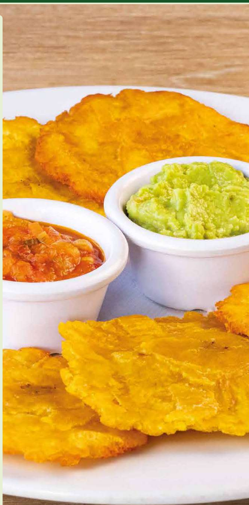
Patacones con Hogao y Guacamole