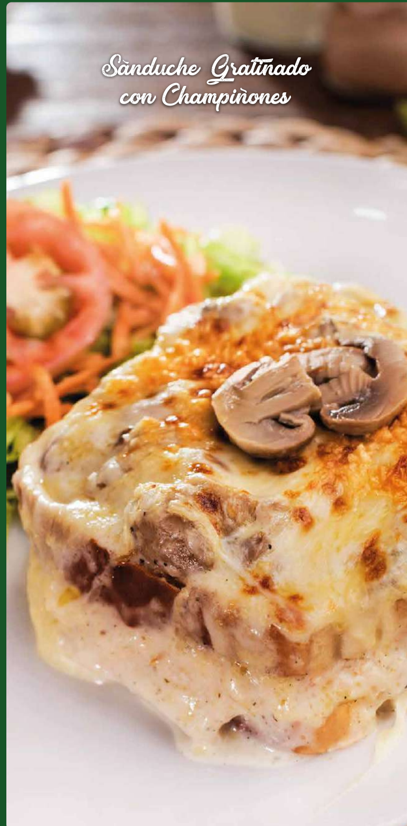
Sanduche Gratinado con Champiñones

(El gratinado de atún no se vende con champiñones)