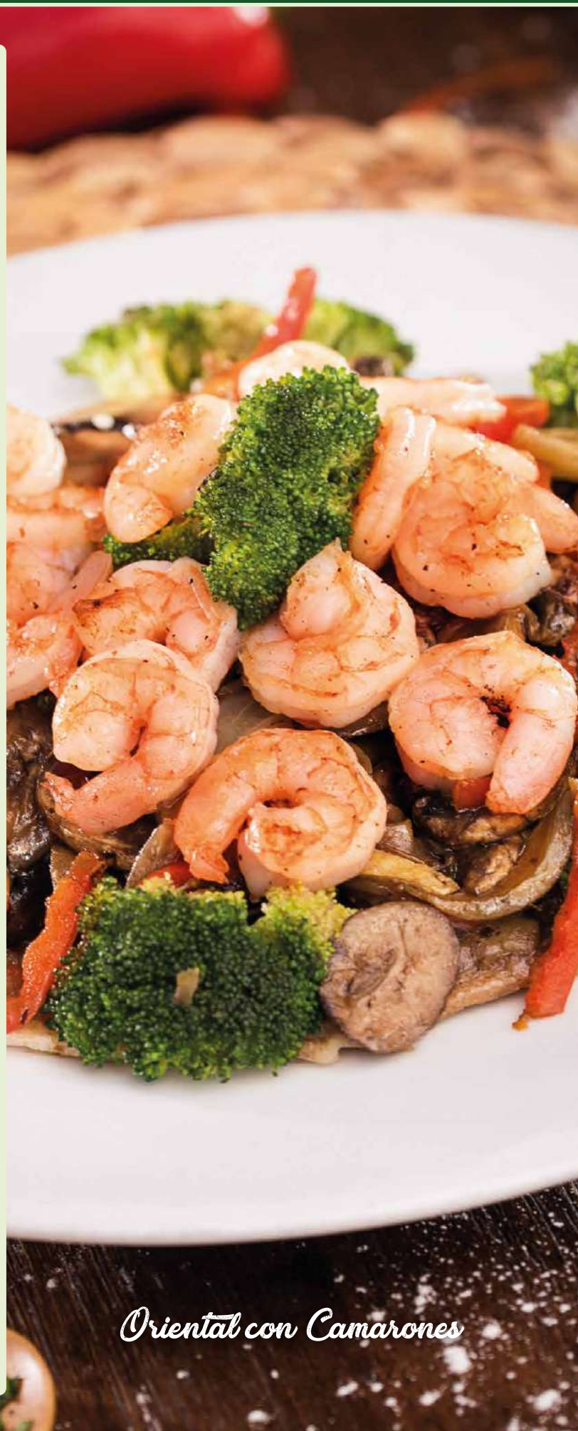
Oriental con Camarones